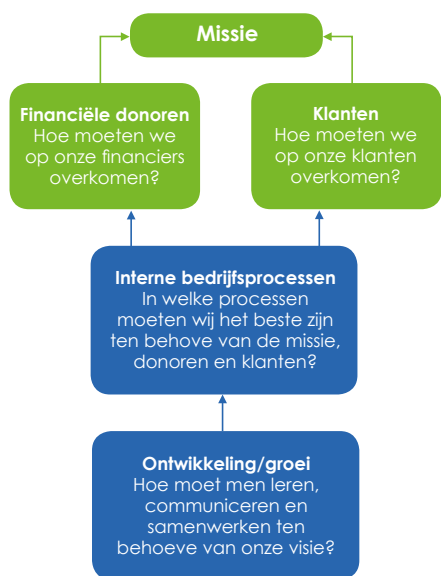
The Balanced Scorecard voor non-profits

In de non-profit industrie zorgen financiële donoren, zoals fondsen, voor de benodigde financiële middelen. Een andere partij ontvangt echter de geleverde dienst. Het is dus niet duidelijk wie de klant is: degene die betaalt, of degene die de dienst ontvangt. Daarom besloot Kaplan beide partijen naast elkaar te zetten, bovenin het model.